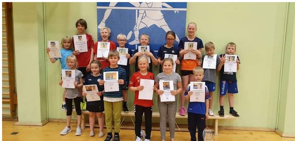
Allir þátttakendur á sumarnámskeiðunum fengu viðurkenningarskjal með mynd af sér.