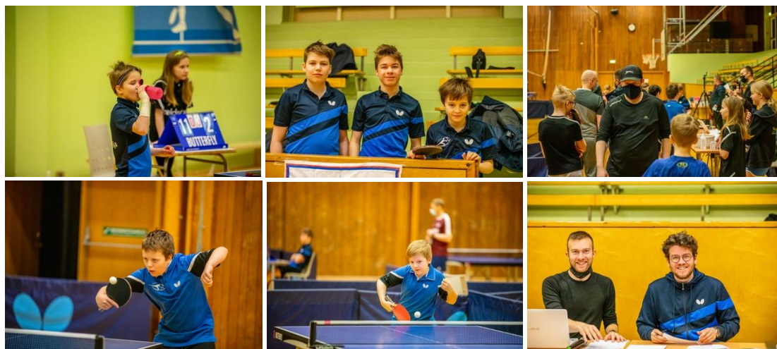
Loksins loksins! Aldursflokkamót í lok janúar 2021

Eftir áramót var hægt að gefa aftur í í æfingum þar sem hlé urðu skammvinnari frá æfingum. Fyrsta aldursflokkamót ársins hélt BH laugardaginn 30. janúar þar sem leikmenn okkar stóðu sig frábærlega og sópuðu til sín titlum mótsins.