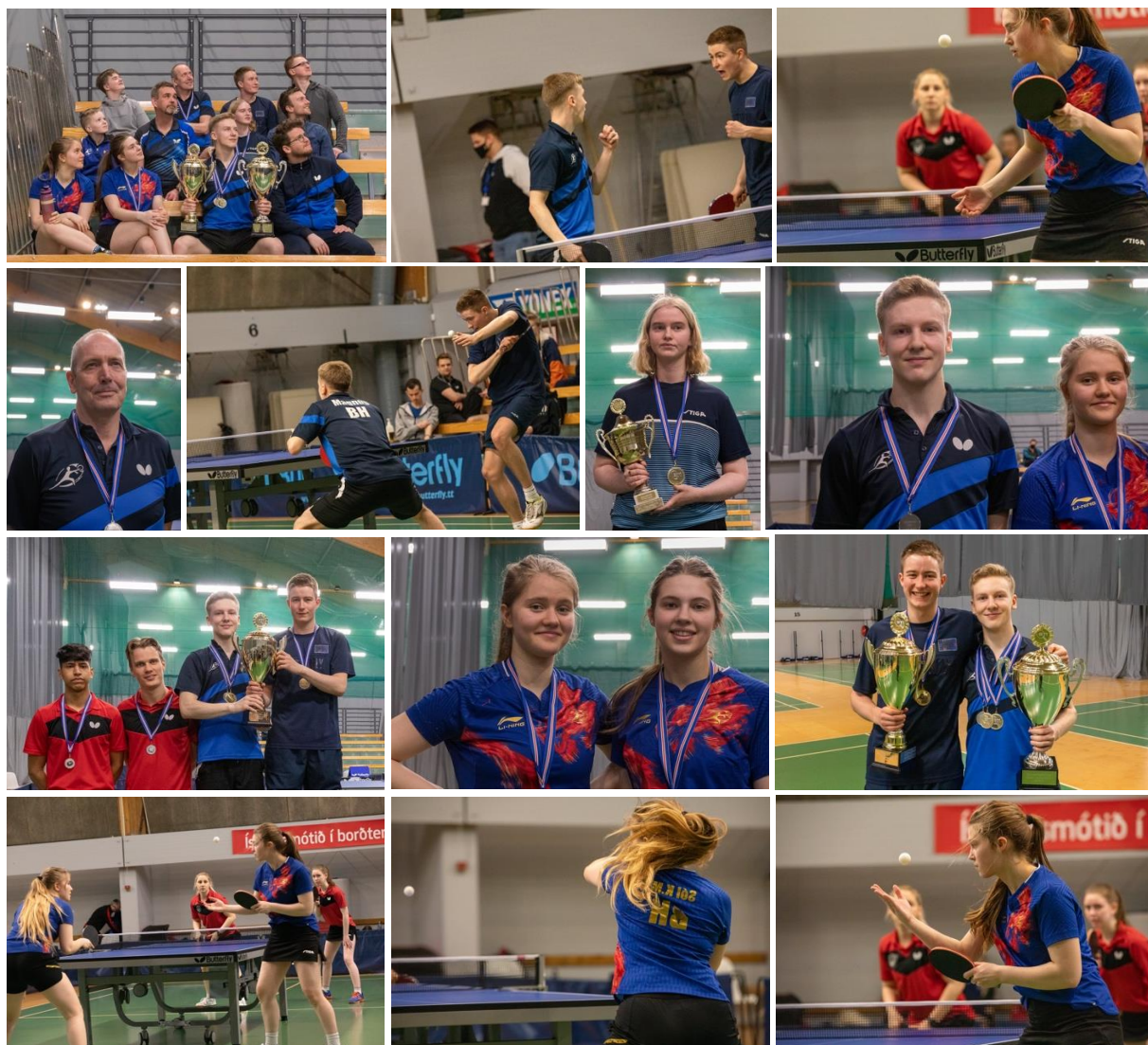
Fullkominn stormur fyrir BH á Íslandsmóti fullorðinna 2021