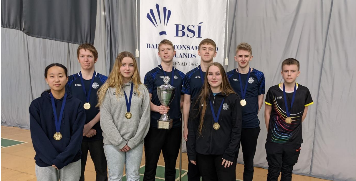
Íslandsmeistarar liða í B-deild 2021.